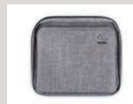
Premium-Reisetasche für AirMini